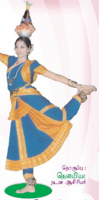
தொகுப்பு : நொன்பியா வென் ஆசிரியர்

பாடல்களை மையமாக கொண்டு நடனங்களை உருவாக்கி அவற்றை அரங்கேற்றம் செய்து அசத்தி வருகின்றனர்.